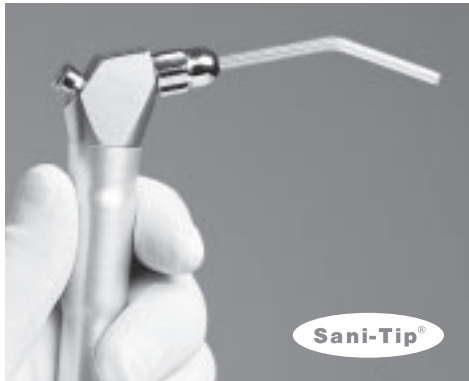
Luft/vand sprøjtespids til engangsbrug